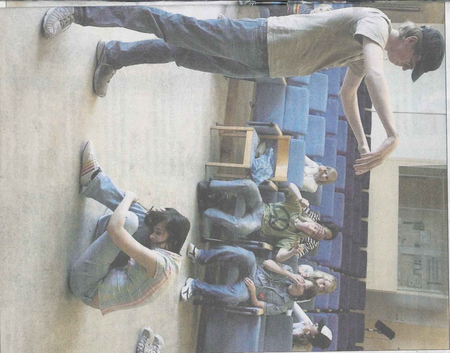
tråder, viser en ny stor internasjonal undersøkelse. 5.000 elever fra 12 europeiske land har deltatt i det toårige pro

PLATE. R.E.M. kaller sitt kommende album «Collapse Into Now» for sitt beste plate siden suksessutgivelsen «Out of Time» fra 1981. – Vi kastet lenkene og skrev hva det måtte være som hørt bra ut. Full guffe-rockere, rolige, triste sanger, flotte midtempolåter i R.E.M.-tradisjon. Det ble kvalitet fra topp til bunn, sier bassist Mike Mills til Rolling Stone. R.E.M. har bestemt seg for ikke å tur- nere i kjølvannet av slippet. NTB