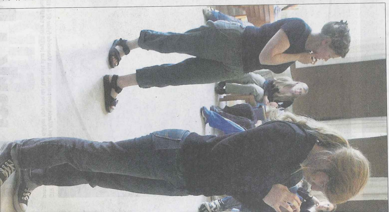
FLINKERE. Ungdom som har drama i undervisningen styrker kompetansen på et slikt.

De fem er: 1) kommunikasjon i morsmal, 2) å lære å lære, 3) mellommenneskelig, flekulturell forståelse, sosial kompetanse